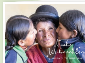
Motiv „Bolivien“ Art.-Nr. 3077