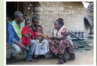
Motiv „Familie in Sierra Leone“ Art.-Nr. 3076