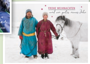
Motiv „Mongolei“ Art.-Nr. 3078