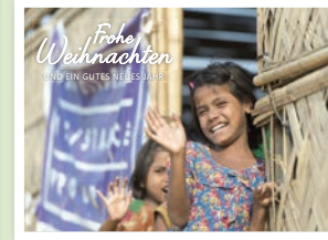
Motiv „Bangladesch“ Art.-Nr. 3074