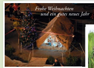
Motiv „Irak“, Art.-Nr. 2952

€ 2,00 UNTERSTÜTZUNGS- ANTEIL PRO KARTENSET GEHEN AN CARITAS INTERNATIONAL