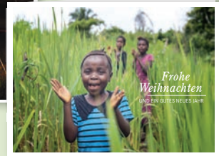
Motiv „Kinder, in Sierra Leone“, Art.-Nr. 3075